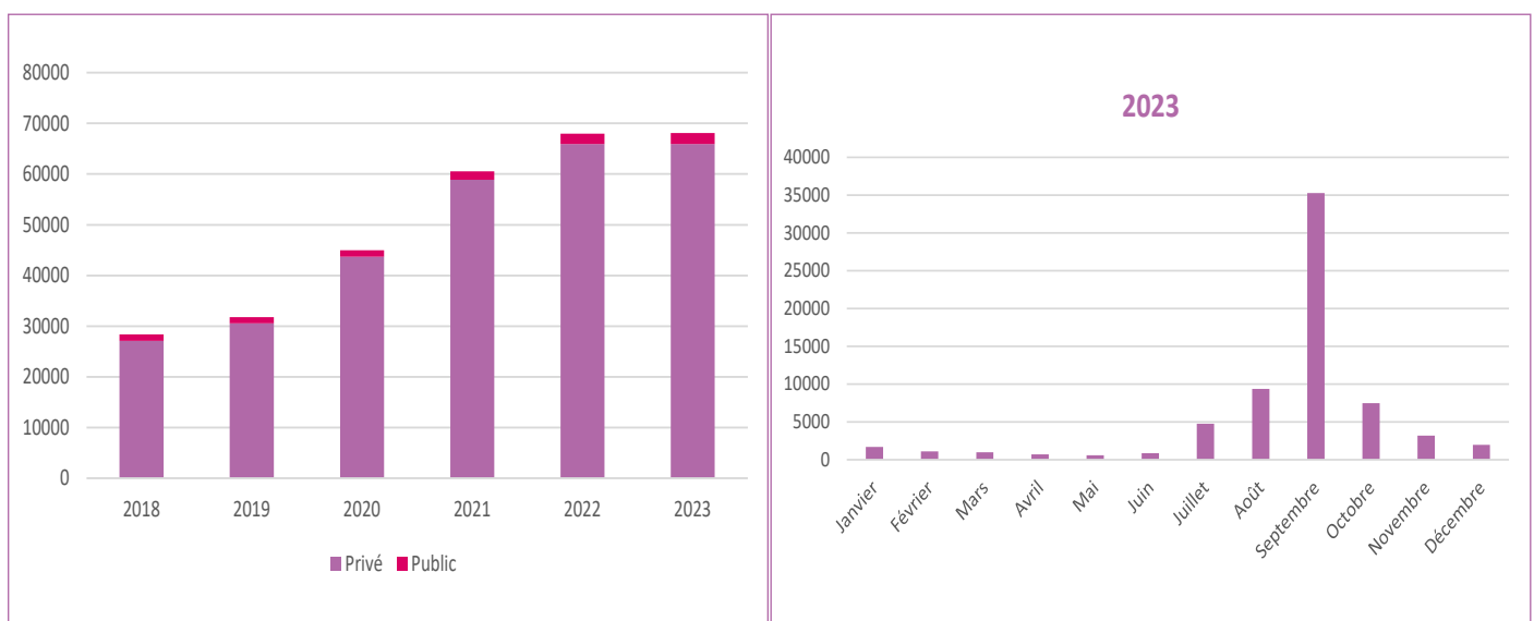
FIGURE 1 : ÉVOLUTION DU NOMBRE DE CONTRATS D'APPRENTISSAGE SIGNÉS

SOURCE : DARES, SYSTÈME D'INFORMATION SUR L'APPRENTISSAGE