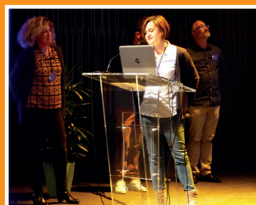
Présentation des 23 réseaux ML