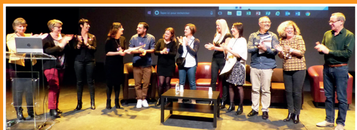
Les organisateurs chaleureusement remerciés par les financeurs