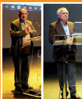
Mot d'accueil par les élus