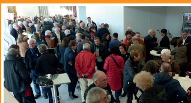
Arrivée au centre de congrès en covoiturage ou en bus