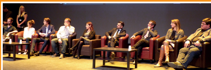
Témoignages des filleul.e.s, marraines parrains