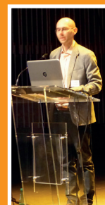
Le carré magique de la relation parrainage